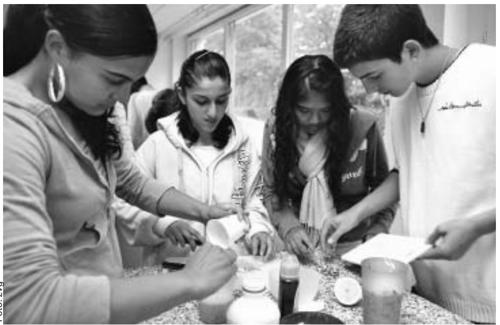
Gemeinsam kochen, damit das Gelernte auch über den Geschmacksinn erlebt wird.