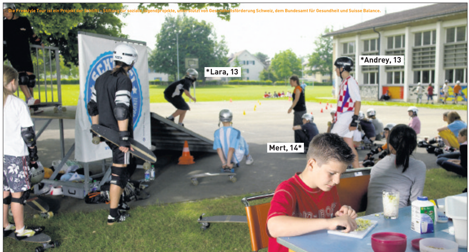
Die Freestyle Tour ist ein Projekt der Schtifti - Stiftung für soziale Jugendprojekte, unterstützt von Gesundheitsförderung Schweiz, dem Bundesamt für Gesundheit und Suisse Balance.

damit die Kinder nicht unbeaufsichtigt hineinfassen oder etwas hineinstecken. Lassen Sie Kinder im Badewasser nicht allein. Schon zehn Zentimeter Wassertiefe können zum Ertrinken ausreichen. Weitere Hinweise zur Kindersicherheit finden Sie auf der Internetsite www.swissmom.ch