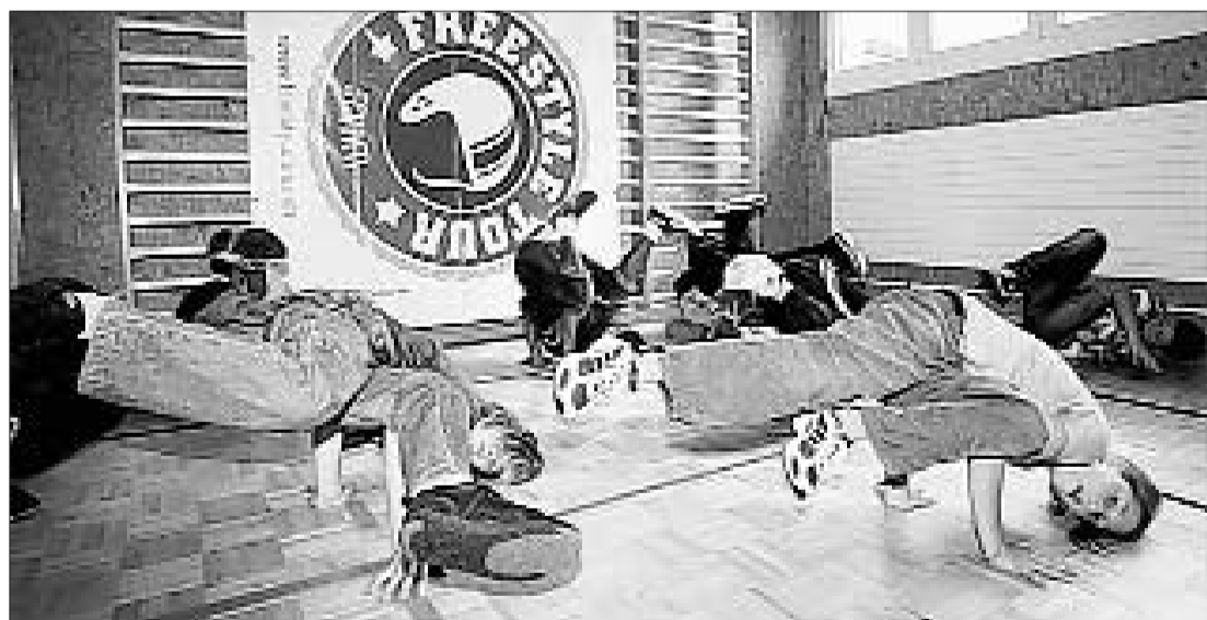
FREESTYLE TOUR Bewegung ist gesund – und macht Spass.

Schon zum fünften Mal organisiert die junge Stiftung Schtifti mit Unterstützung von Suisse Balance, der Ernährungsbewegung vom Bundesamt für Gesundheit und von Gesundheitsförderung Schweiz, eine Freestyle Tour durch die Schweiz. Alle Schulen sind zum Mitmachen eingeladen.